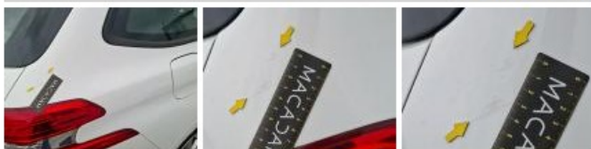
Bas de caisse ext D, Bosse(s), LI - Réparer et peindre (complet)