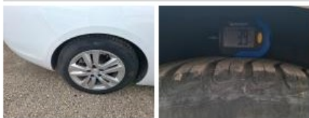
Pneu AVD, Hors tolérance, E - Remplacer