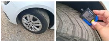
Pneu ARD, Hors tolérance, E - Remplacer