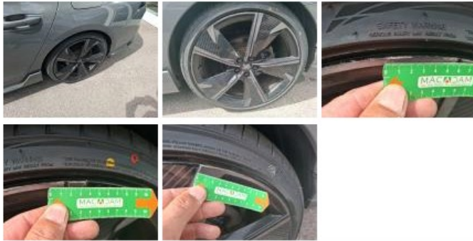
Jante alum. ARD bi-ton/polychrome, Griffe(s), Réparer/rempl. (montant forfaitaire)