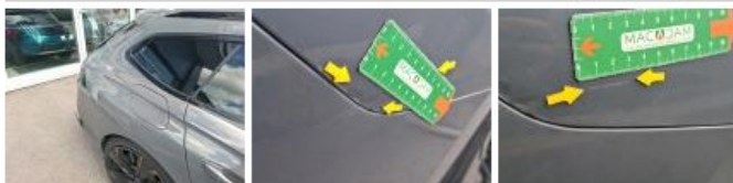
Boitier rétroviseur ext D, Griffe(s), Lustrage