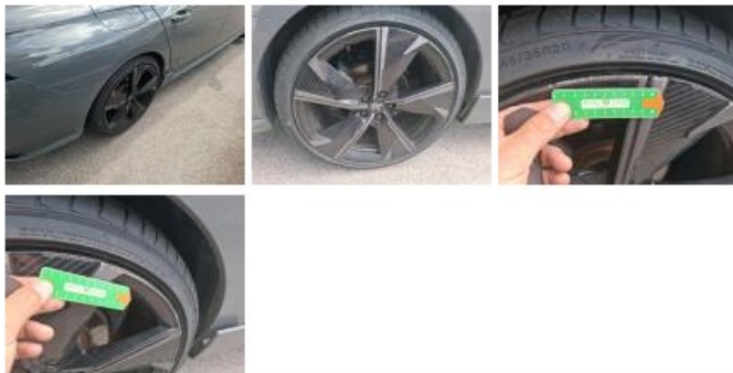
Jante alum. AVD bi-ton/polychrome, Griffe(s), Réparer/rempl. (montant forfaitaire)