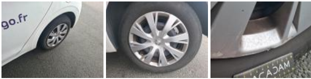
Enjoliveur de roue AVD, Cassé, E - Remplacer