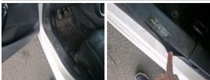
Garniture porte ARG, Griffes(s), Réparer/rempl. (montant forfaitaire)