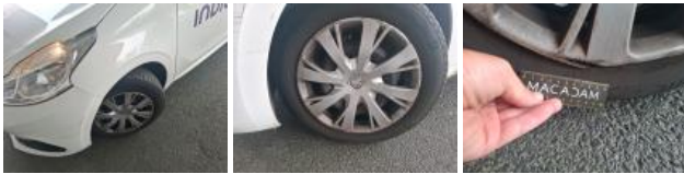
Enjoliveur de roue ARG, Déformé / Forcé, E - Remplacer