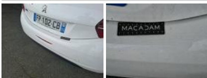
Carrosserie, Pas d'origine, Délettrage