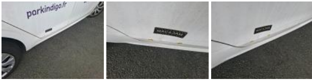
Aile AVD, Bosse(s), LI - Réparer et peindre (complet)