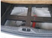
Jante de secours, Manque, E - Remplacer