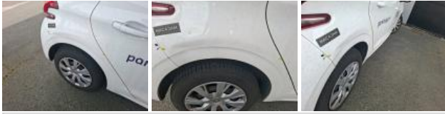
Porte ARD, Bosse(s), LI - Réparer et peindre (complet)