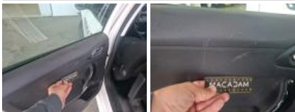
Joint de porte AVD, Déchirure, E - Remplacer