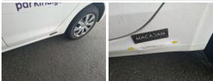
Aile ARG, Bosse(s), LI - Réparer et peindre (complet)