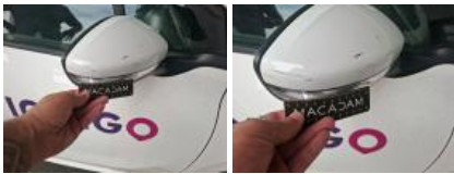
Répétiteur D, Fêlure, E - Remplacer