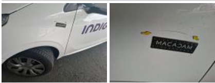
Porte AVG, Griffe(s), Peindre