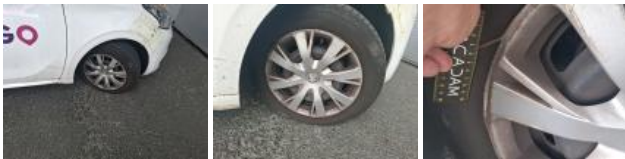
Aile AVG, Griffe(s), Peindre