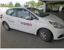
Pavillon, Bosse(s), LI - Réparer et peindre (complet)