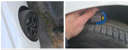
Jante alum. AVG bi-ton/polychrome, Griffe(s), Réparer/rempl. (montant forfaitaire)