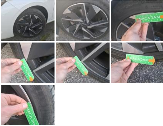
Pneu ARD, Hors tolérance, E - Remplacer