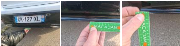
Pare-chocs AR, Griffe(s), Acceptable