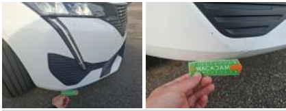
Aile ARD, Bosse(s), LI - Réparer et peindre (complet)