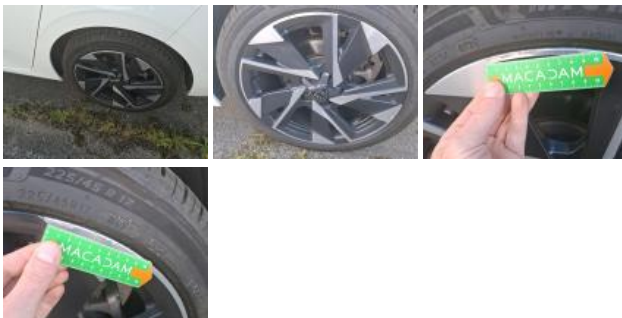
Jante alum. AVD bi-ton/polychrome, Griffe(s), Réparer/rempl. (montant forfaitaire)