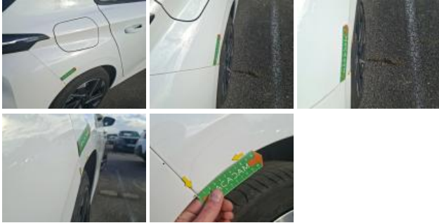
Jupe AR, Griffe(s), Peindre