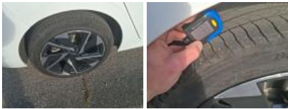
Jante alum. ARD bi-ton/polychrome, Griffe(s), Réparer/rempl. (montant forfaitaire)