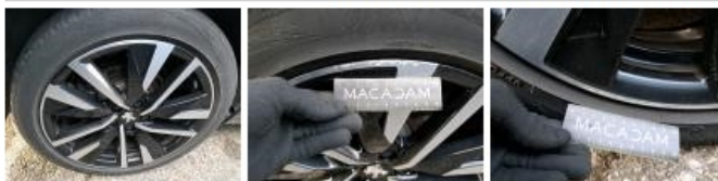
Pneu ARD, Hors tolérance, E - Remplacer