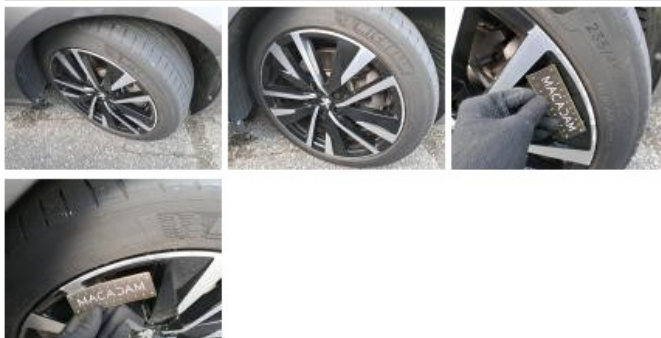
Jante alum. ARD bi-ton/polychrome, Griffe(s), Réparer/rempl. (montant forfaitaire)