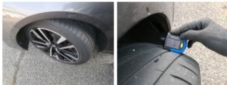
Jante alum. AVG bi-ton/polychrome, Griffe(s), Réparer/rempl. (montant forfaitaire)