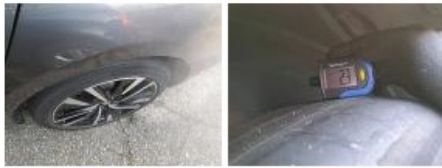
Pneu AVG, Hors tolérance, E - Remplacer