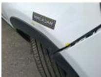
Moulure d'aile AVD, Déformé / Forcé, E - Remplacer