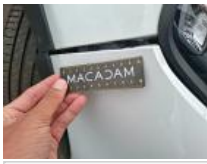
Moulure de pare-chocs AVD, Griffe(s), Réparer/rempl. (montant forfaitaire)