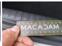
Pare-chocs AR, Griffe(s), Réparer/rempl. (montant forfaitaire)