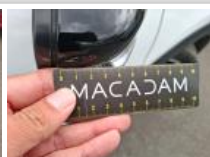
Répétiteur D, Griffe(s), E - Remplacer