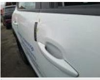
Porte ARD, Griffe(s), Lustrage