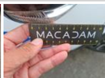
Porte AVD, Bosse(s), LI - Réparer et peindre (complet)