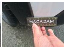
Carrosserie, Pas d'origine, Délettrage