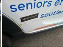
Garnit. bas de caisse ext D, Griffe(s), Acceptable