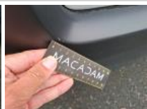
Moulure de pare-chocs ARG, Griffe(s), Réparer/rempl. (montant forfaitaire)