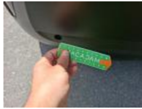
Moulure de pare-chocs AR, Cassé, E - Remplacer