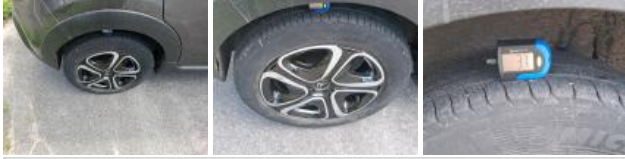
Pneu AVD, Hors tolérance, E - Remplacer