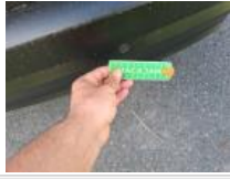
Capteur de parking AR, Manque, E - Remplacer