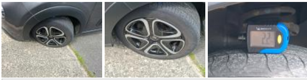
Pneu ARG, Hors tolérance, E - Remplacer