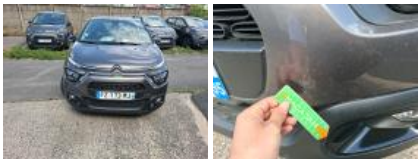
Moulure d'aile ARD, Griffe(s), E - Remplacer