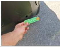
Capteur de parking AR, Manque, E - Remplacer