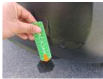
Pare-chocs AR, Griffe(s), Lustrage