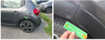
Moulure de pare-chocs AV, Griffe(s), E - Remplacer