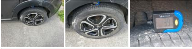
Pneu ARD, Hors tolérance, E - Remplacer