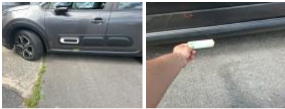
Moulure porte ARG, Griffe(s), Acceptable