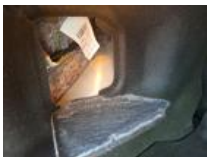
Capteur de parking AR, Manque, E - Remplacer