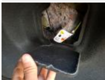
Kit réparation pneu, Manque, Réparer/rempl. (montant forfaitaire)