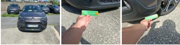
Capot, Griffe(s), Lustrage