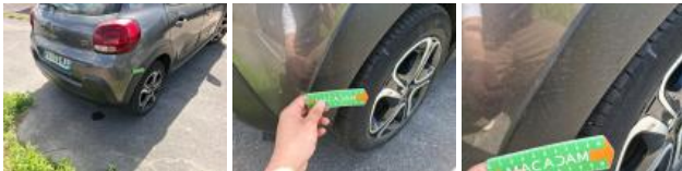
Moulure d'aile AVD, Griffe(s), Réparer/rempl. (montant forfaitaire)