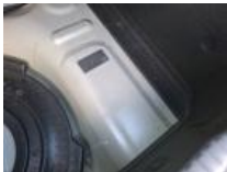
Compresseur, Manque, Réparer/rempl. (montant forfaitaire)