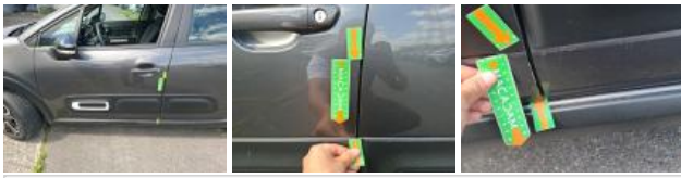
Moulure d'aile ARG, Griffe(s), E - Remplacer