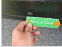
Capteur de parking AR, Manque, E - Remplacer