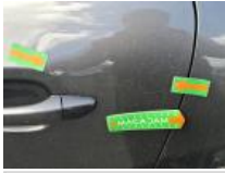
Porte AVG, Griffe(s), Acceptable