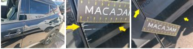
Aile ARG, Griffe(s), Peindre