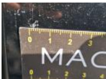
Moulure de pare-chocs AR, Griffe(s), Peindre