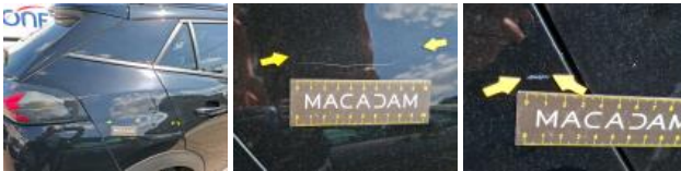
Porte ARD, Bosse(s) et griffe(s), LI - Réparer et peindre (complet)