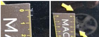
Porte AVD, Griffe(s), Peindre