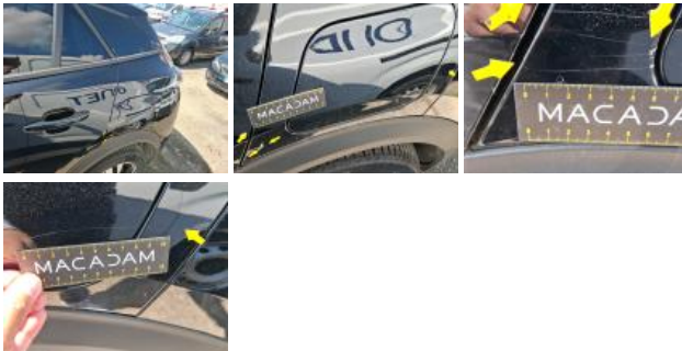
Aile ARD, Griffe(s), Peindre