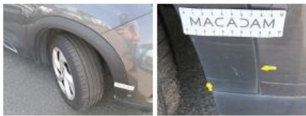
Porte AVD, Bosse(s) et griffe(s), LI - Réparer et peindre (complet)