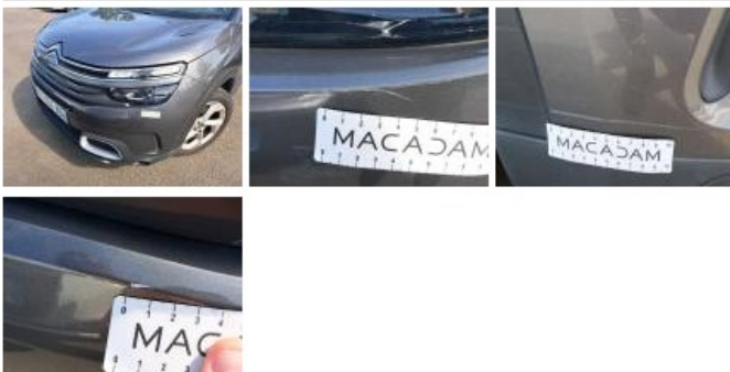
Moulure d'aile AVD, Griffe(s), Acceptable