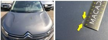
Pare-chocs AV, Griffe(s), Peindre