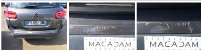
Moulure de pare-chocs AR, Griffe(s), Réparer/remplacer (montant forfaitaire)