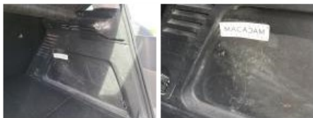
Garnit. zone de chargement, Griffe(s), Acceptable