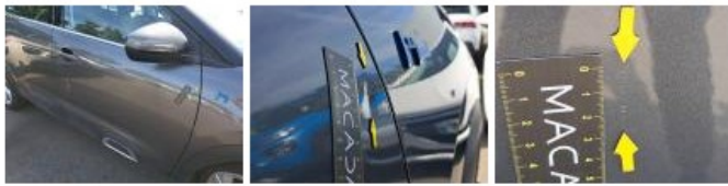
Porte ARD, Griffe(s), Peindre