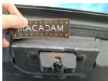
Joint de coffre/hayon, Dégrafé, Dépose/Répose