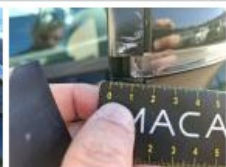
Base rétroviseur ext D, Griffe(s), Acceptable