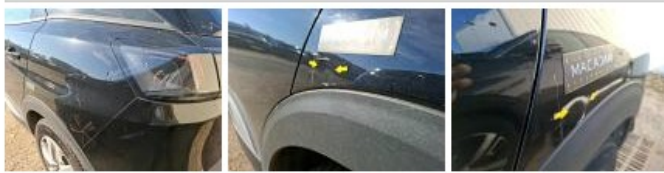
Porte ARG, Bosse(s) et griffe(s), LI - Réparer et peindre (complet)