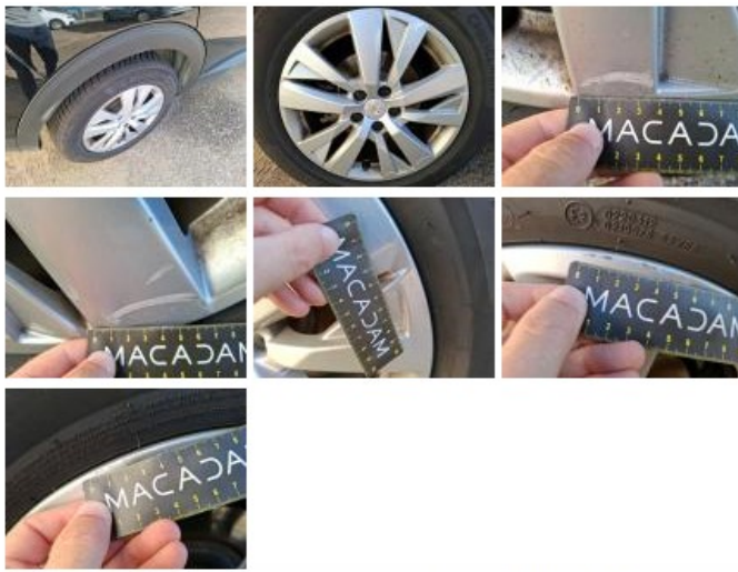
Jante alum. AVD, Griffe(s), Réparer/rempl. (montant forfaitaire)