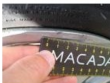
Jante alum. ARD, Griffe(s), Acceptable