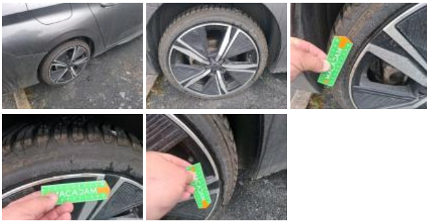
Jante alum. AVD bi-ton/polychrome, Griffe(s), Réparer/rempl. (montant forfaitaire)