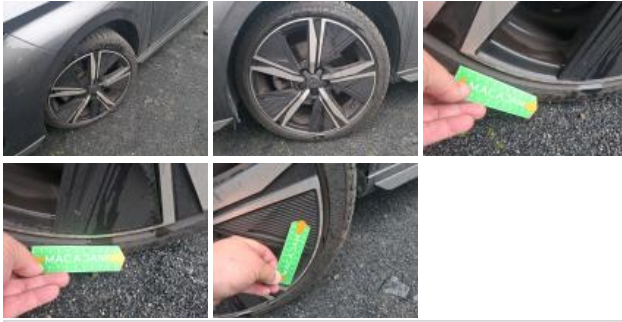
Jante alum. ARD bi-ton/polychrome, Griffe(s), Réparer/rempl. (montant forfaitaire)