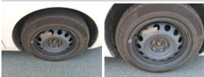
Jante tôle AVD, Déformé / Forcé, Acceptable