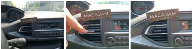
Grille vent. M, Endommagé, E - Remplacer