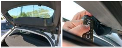
Garniture intérieur, Manque, E - Remplacer