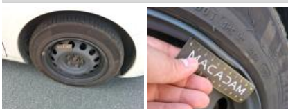
Pneu AVD, Déchirure, E - Remplacer