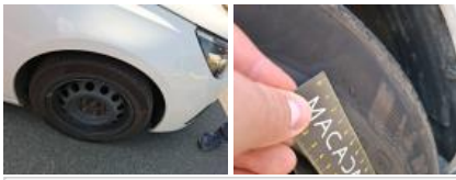
Pneu AVG, Déchirure, E - Remplacer