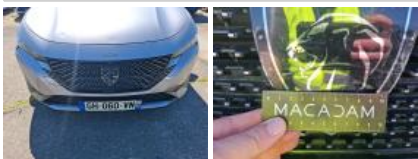
Capot, Bosse(s), LI - Réparer et peindre (complet)