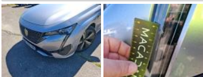
Aile ARD, Bosse(s) et griffe(s), LI - Réparer et peindre (complet)