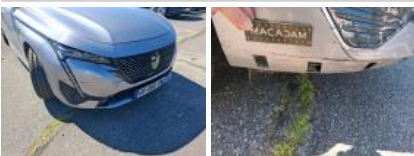
Moulure de pare-chocs AVG, Griffe(s), Peindre