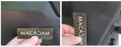
Pavillon (Break), Griffe(s), Peindre