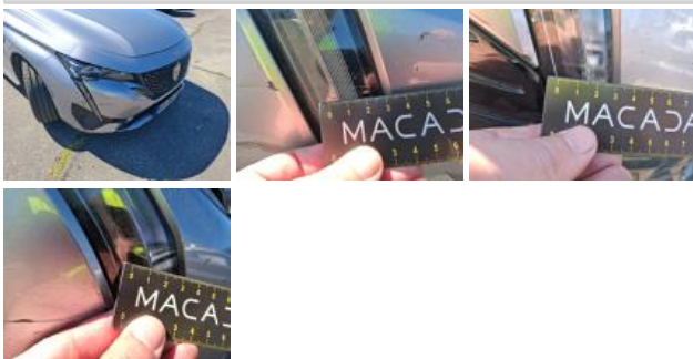
Grille de pare-chocs AV M, Cassé, E - Remplacer