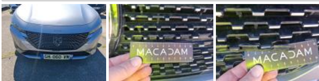
Monogramme marque AV, Cassé, E - Remplacer