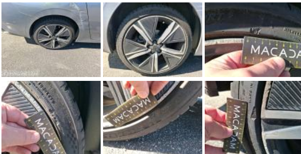
Jante alum. ARG bi-ton/polychrome, Griffes(s), Réparer/rempl. (montant forfaitaire)