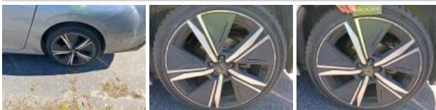
Pneu ARG, Déchirure, E - Remplacer