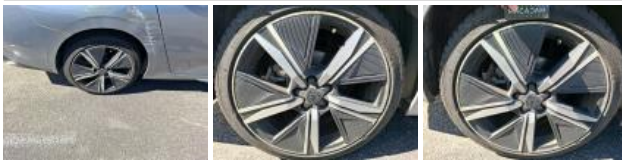
Pneu ARD, Déchirure, E - Remplacer