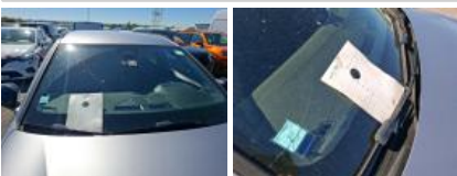
Kit collage vitrage, Nécessaire repose vitrage, Réparer/rempl. (montant forfaitaire)