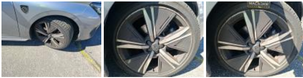
Jante alum. ARD bi-ton/polychrome, Griffes(s), Réparer/rempl. (montant forfaitaire)