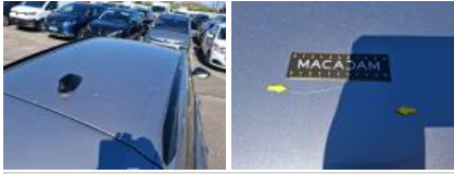
Barre de toit D, Griffe(s), Peindre