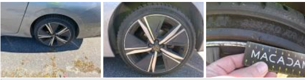
Jante alum. AVG bi-ton/polychrome, Griffe(s), Réparer/rempl. (montant forfaitaire)