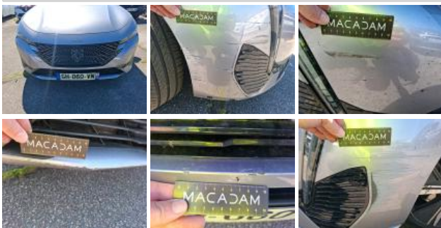
Feu de jour AVD, Fêlure, E - Remplacer