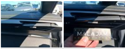
Console centrale, Déchirure, E - Remplacer