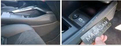
Garniture porte AVD, Déchirure, E - Remplacer