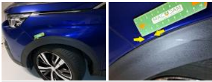
Porte ARG, Bosse(s), LI - Réparer et peindre (complet)