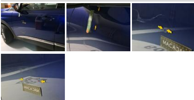
Aile AVG, Griffe(s), Acceptable