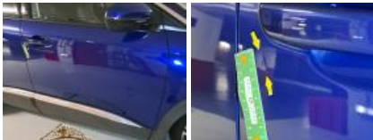
Porte ARD, Bosse(s), LI - Réparer et peindre (complet)