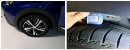
Jante alum. AVG bi-ton/polychrome, Griffe(s), Réparer/rempl. (montant forfaitaire)