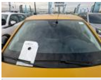
Pare-brise, Fêlure, E - Remplacer