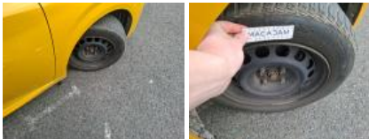
Enjoliveur de roue ARD, Manque, E - Remplacer