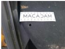
Cache bagages, Cassé, E - Remplacer