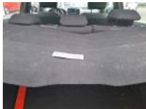
Garnit. couvercle AR, Griffe(s), Réparer/rempl. (montant forfaitaire)