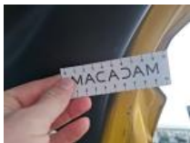
Pare-chocs AR, Déformé / Forcé, Le - Remplacer et peindre