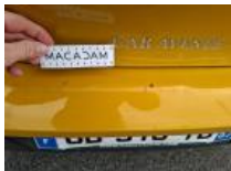
Coffre / hayon, Bosse(s), LI - Réparer et peindre (complet)