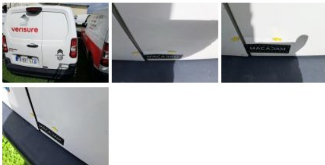
Carrosserie, Pas d'origine, Déletterage