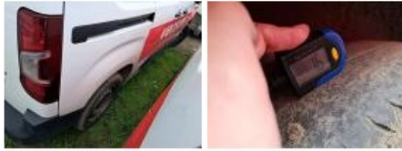
Pneu AVD, Hors tolérance, E - Remplacer