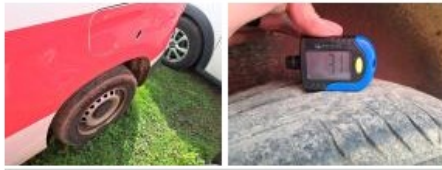
Pneu ARD, Hors tolérance, E - Remplacer