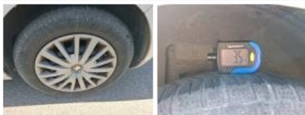
Pneu ARD, Hors tolérance, E - Remplacer