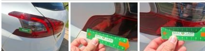
Pare-chocs AR, Griffe(s), Acceptable