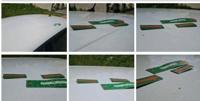
Carrosserie, Pas d'origine, Acceptable