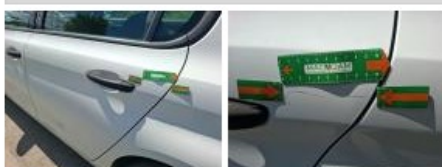
Aile ARG, Griffes(s), Lustrage