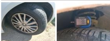
Enjoliveur de roue AVD, Cassé, E - Remplacer