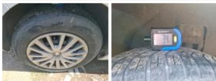
Pneu AVD, Hors tolérance, E - Remplacer