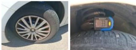
Pneu ARG, Hors tolérance, E - Remplacer