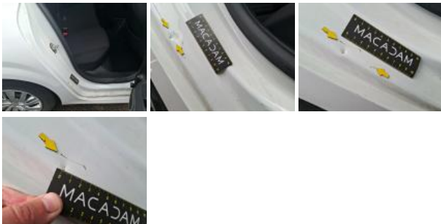
Garnit. montant Mil D, Griffe(s), Réparer/rempl. (montant forfaitaire)