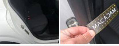
Revêtement assise siège AVD, Tache, E - Remplacer