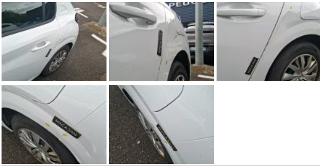
Porte ARG, Griffe(s), Peindre