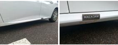
Aile ARG, Bosse(s) et griffe(s), LI - Réparer et peindre (complet)