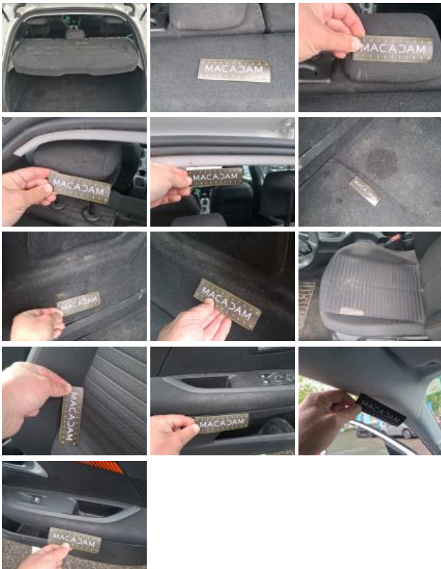
Tapis de sol AV, Déchirure, Réparer/rempl. (montant forfaitaire)