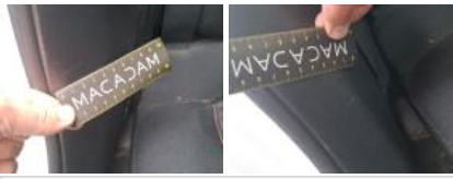
Joint de porte ARD, Déchirure, E - Remplacer