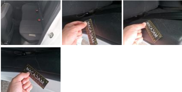
Bas de caisse int ARD, Bosse(s) et griffe(s), LI - Réparer et peindre (complet)