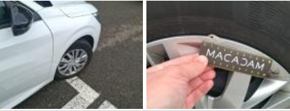
Enjoliveur de roue ARG, Cassé, E - Remplacer