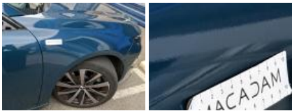
Porte AVD, Mauvaise réparation, Peindre