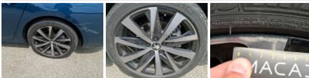
Jante alum. AVG bi-ton/polychrome, Griffe(s), Réparer/rempl. (montant forfaitaire)