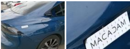
Montant de toit D, Mauvaise réparation, Peindre