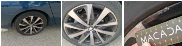
Jante alum. ARG bi-ton/polychrome, Griffe(s), Acceptable