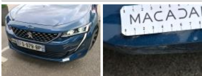
Aile AVD, Mauvaise réparation, Peindre