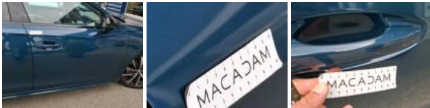
Porte ARD, Mauvaise réparation, Peindre