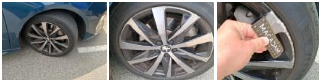
Jante alum. ARD bi-ton/polychrome, Griffe(s), Réparer/rempl. (montant forfaitaire)