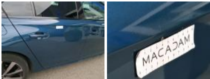
Aile ARD, Mauvaise réparation, Peindre