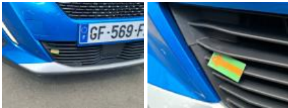
Moulure de pare-chocs AV, Cassé, Le - Remplacer et peindre