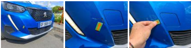
Grille de pare-chocs AV M, Cassé, E - Remplacer