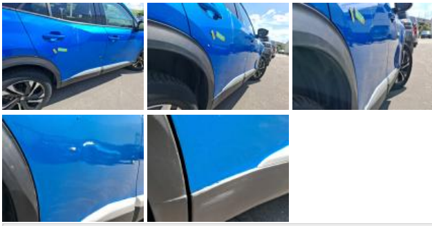
Moulure porte ARD, Griffe(s), E - Remplacer