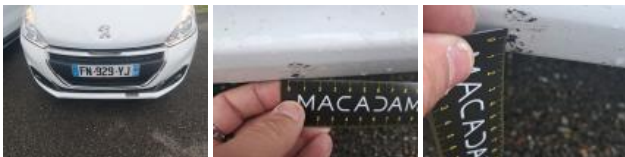
Aile AVD, Bosse(s), Acceptable