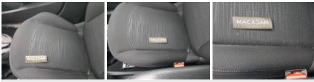
Revêtement assise siège AVG, Tache, Nettoyer