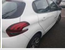
Antenne, Endommagé, E - Remplacer