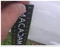
Carrosserie, Pas d'origine, Délettrage