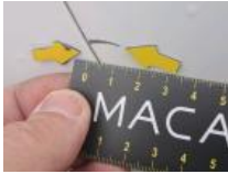
Aile ARG, Griffe(s), Lustrage