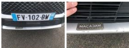
Moulure de pare-chocs AV, Griffe(s), Peindre