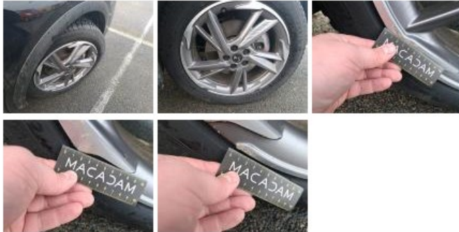
Porte AVG, Bosse(s) et griffe(s), Acceptable