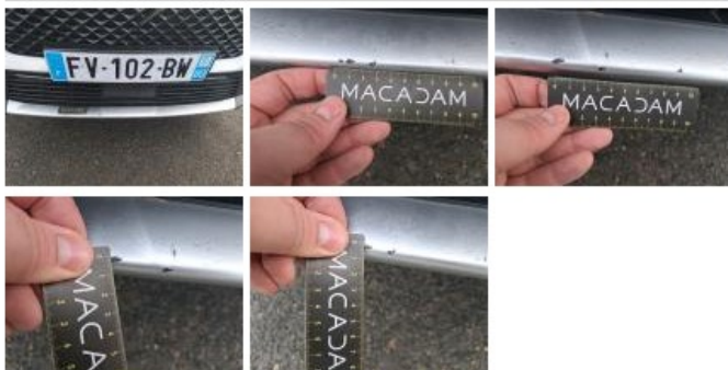
Pare-chocs AV, Griffe(s), Peindre