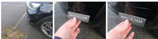
Spoiler AV, Griffe(s), E - Remplacer