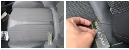
Revêtement assise siège AVG, Déchirure, E - Remplacer