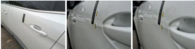
Aile ARD, Bosse(s), LI - Réparer et peindre (complet)