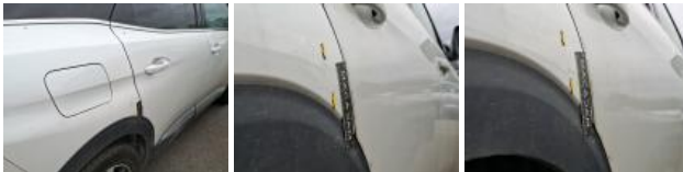
Porte AVD, Bosse(s), Acceptable