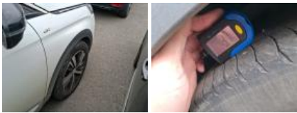
Pneu AVG, Hors tolérance, E - Remplacer