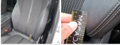
Revêtement assise ARG, Tache, Nettoyer