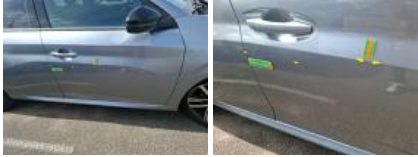
Porte ARD, Griffe(s), Lustrage