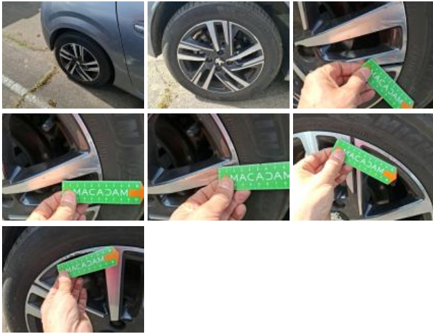
Jante alum. ARG bi-ton/polychrome, Griffe(s), Réparer/rempl. (montant forfaitaire)