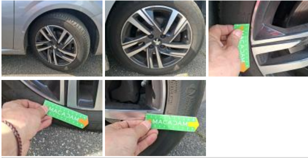
Jante alum. ARD bi-ton/polychrome, Griffe(s), Réparer/rempl. (montant forfaitaire)