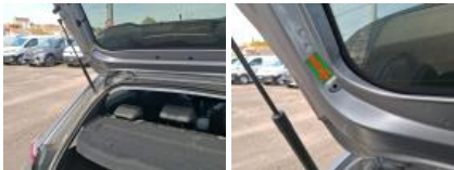
Garnit. int D coffre, Dégrafé, Dépose/Repose