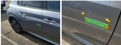
Aile ARD, Bosse(s), Acceptable