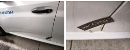
Pare-chocs AV, Différence de teinte, Peindre