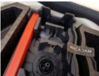
Kit réparation pneu, Manque, Réparer/rempl. (montant forfaitaire)