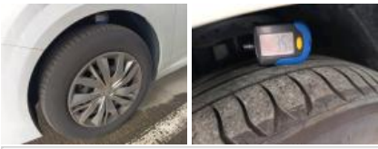
Pneu ARD, Hors tolérance, E - Remplacer