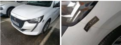
Aile AVD, Bosse(s) et griffe(s), LI - Réparer et peindre (complet)