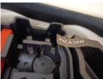
Carrosserie, Pas d'origine, Petit délettrage