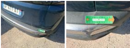
Pare-chocs AR, Griffe(s), E - Remplacer