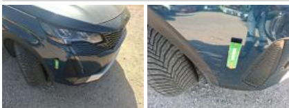
Moulure d'aile ARD, Dégrafé, Dépose/Repose