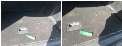
Garnit. zone de chargement, Cassé, E - Remplacer