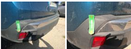
Feu antibrouillard ARG, Cassé, E - Remplacer