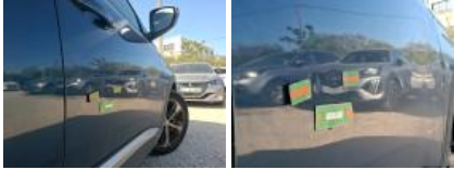
Moulure d'aile AVD, Griffe(s), E - Remplacer