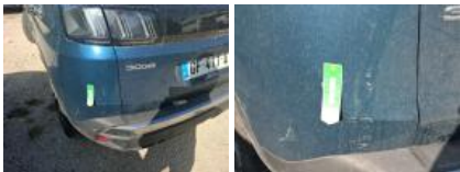
Moulure de pare-chocs AR, Griffe(s), E - Remplacer