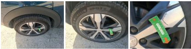
Pneu AVD, Hors tolérance, E - Remplacer