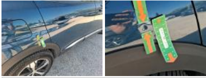
Porte AVD, Bosse(s), LI - Réparer et peindre (complet)