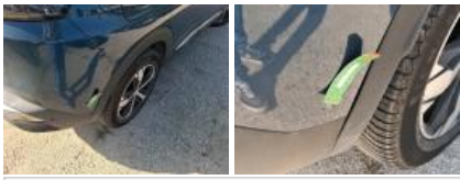
Aile ARD, Bosse(s) et griffe(s), Acceptable