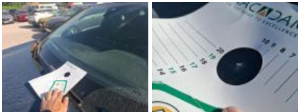
Kit collage vitrage, Nécessaire repose vitrage, Réparer/rempl. (montant forfaitaire)