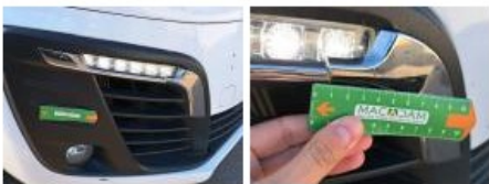
Moulure de pare-chocs AVD, Griffe(s), E - Remplacer