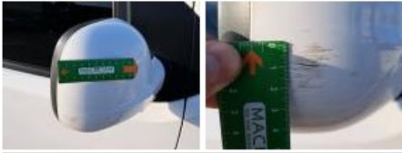
Aile AVD, Bosse(s) et griffe(s), LI - Réparer et peindre (complet)