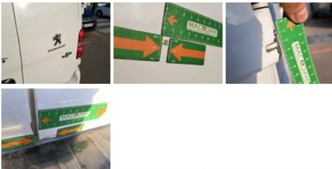
Porte de malle AR G, Bosse(s) et griffe(s), LI - Réparer et peindre (complet)