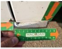
Boitier rétroviseur ext D, Griffes), Peindre