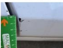
Bas de caisse ext G, Bosse(s) et griffe(s), Le - Remplacer et peindre