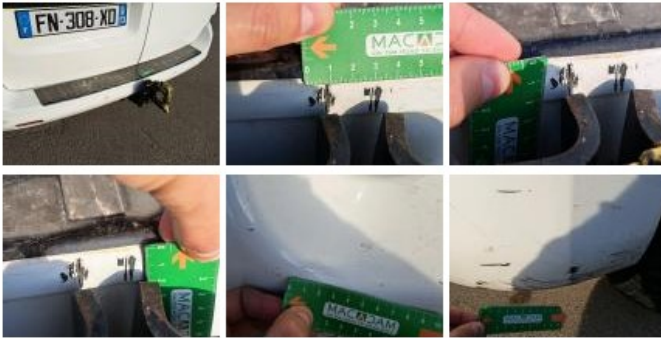
Porte de malle AR D, Bosse(s) et griffe(s), LI - Réparer et peindre (complet)