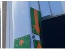
Panneau ARD, Bosse(s) et griffe(s), LI - Réparer et peindre (complet)