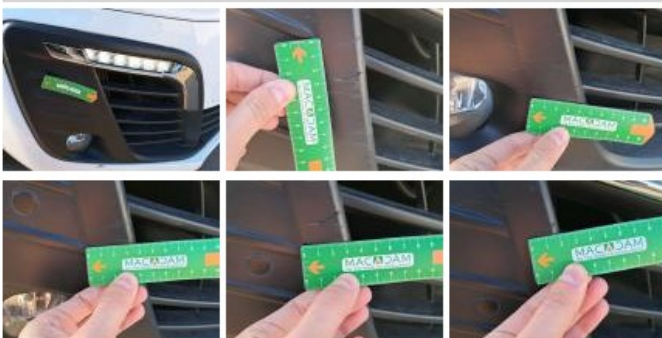
Grille de pare-chocs AV M, Cassé, E - Remplacer