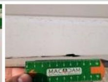
Porte AVD, Bosse(s) et griffe(s), LI - Réparer et peindre (complet)