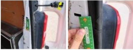
Pare-chocs AR, Déformé / Forcé, LI - Réparer et peindre (complet)