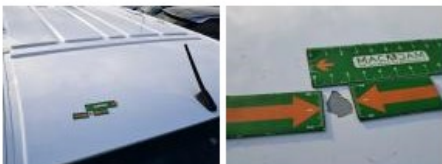
Pavillon cabine, Bosse(s) et griffe(s), LI - Réparer et peindre (complet)