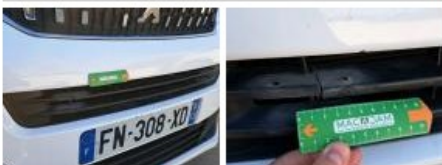
Grille de pare-chocs AV M, Dégrafé, Dépose/Répose