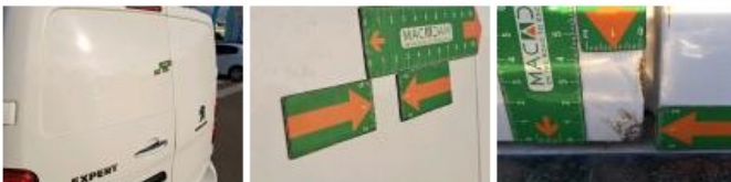
Pavillon cabine, Griffes), Peindre