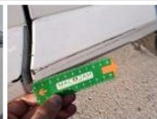
Bas de caisse ext D, Bosse(s) et griffe(s), LI - Réparer et peindre (complet)