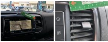
Intérieur, Sale, Nettoyer