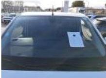
Pare-brise, Eclat(s), E - Remplacer