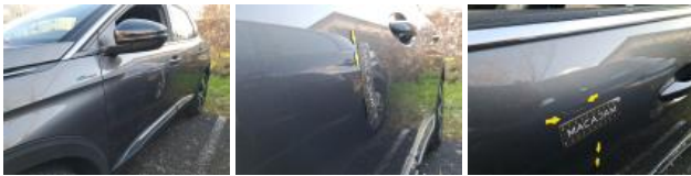
Porte ARG, Bosse(s), LI - Réparer et peindre (complet)