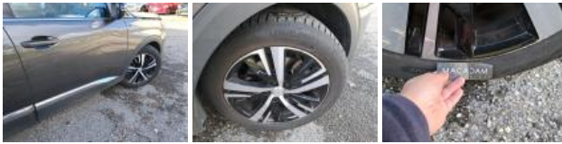
Pneu AVD, Déchirure, E - Remplacer