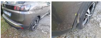
Aile ARD, Bosse(s), Acceptable