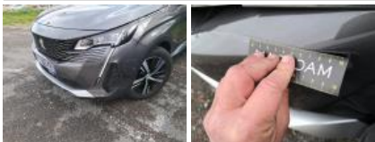
Moulure de pare-chocs AV, Griffe(s), Peindre