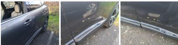
Aile ARG, Bosse(s), Acceptable