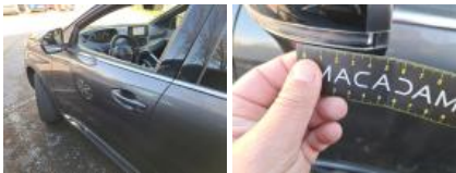
Porte AVG, Bosse(s) et griffe(s), Acceptable