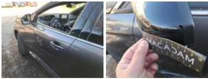
Répétiteur G, Griffe(s), E - Remplacer