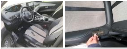
Revêtement dossier AVG, Brûlé, E - Remplacer