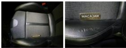
Revêtement dossier AVG, Déchirure, E - Remplacer