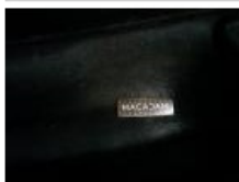
Kit réparation pneu, Manque, Réparer/rempl. (montant forfaitaire)