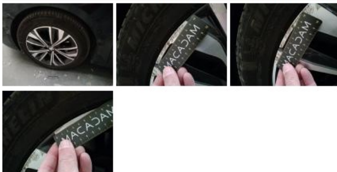
Jante alum. ARG bi-ton/polychrome, Griffe(s), Acceptable