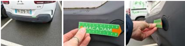
Garnit. zone de chargement, Griffe(s), Réparer/rempl. (montant forfaitaire)