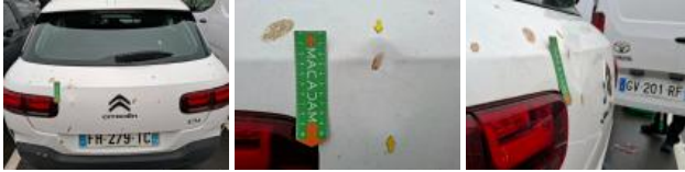
Pare-chocs AR, Griffe(s), Peindre