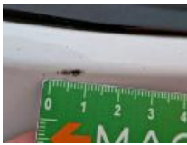
Calandre, Cassé, E - Remplacer