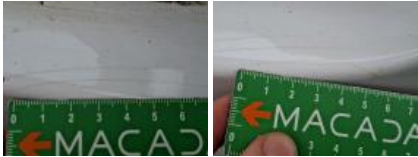
Pare-chocs AR, Déformé / Forcé, LI - Réparer et peindre (complet)