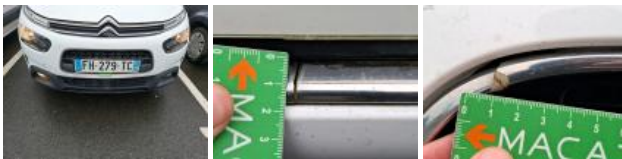
Grille de pare-chocs AV M, Cassé, E - Remplacer