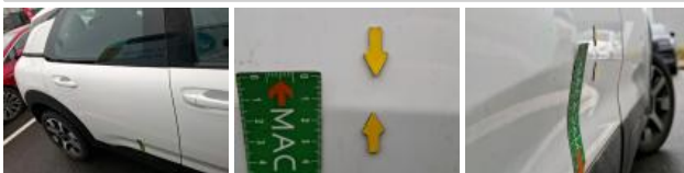
Aile AVD, Griffe(s), Lustrage