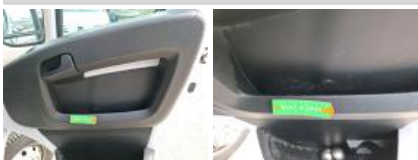
Garniture intérieur, Manque, E - Remplacer