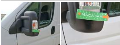
Porte AVG, Bosse(s) et griffe(s), Acceptable