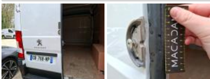
Carrosserie, Pas d'origine, Délettrage