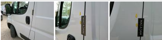
Moulure de montant milieu D, Griffe(s), Réparer/rempl. (montant forfaitaire)