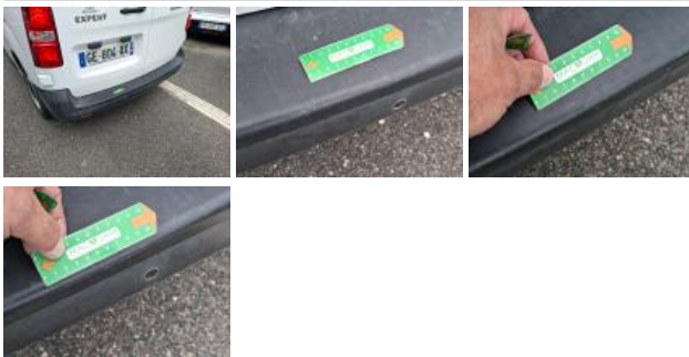
Carrosserie, Pas d'origine, Petit délettrage