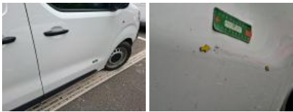
Moulure porte AVD, Griffe(s), E - Remplacer