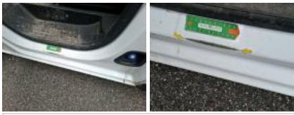
Bas de caisse int AVD, Bosse(s) et griffe(s), LI - Réparer et peindre (complet)