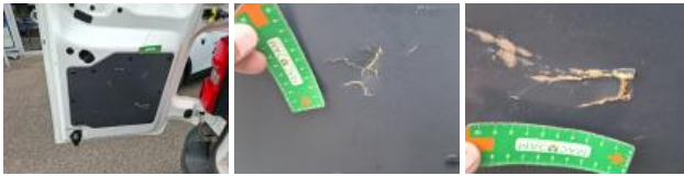
Porte de malle AR G, Griffe(s), Peindre