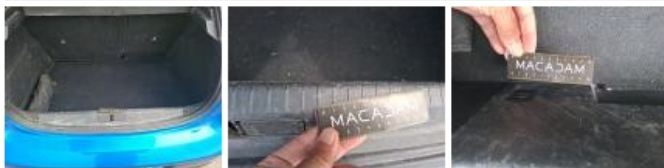
Cache bagages, Déformé / Forcé, E - Remplacer