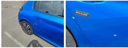
Aile ARD, Bosse(s) et griffe(s), LI - Réparer et peindre (complet)