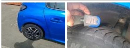
Pneu ARG, Hors tolérance, E - Remplacer