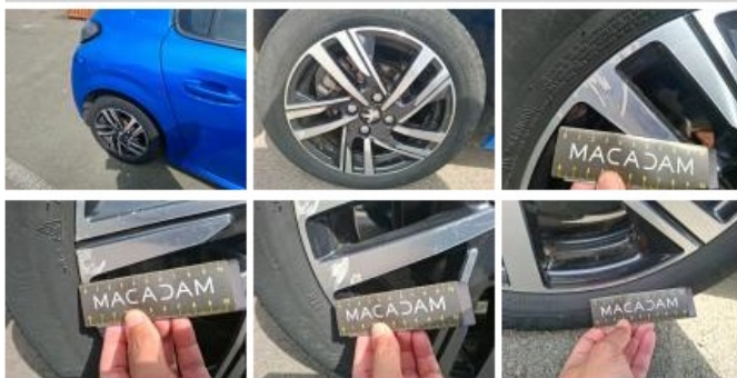
Pneu ARD, Hors tolérance, E - Remplacer