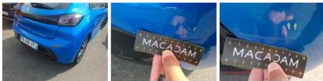
Moulure de pare-chocs AR, Griffe(s), Peindre