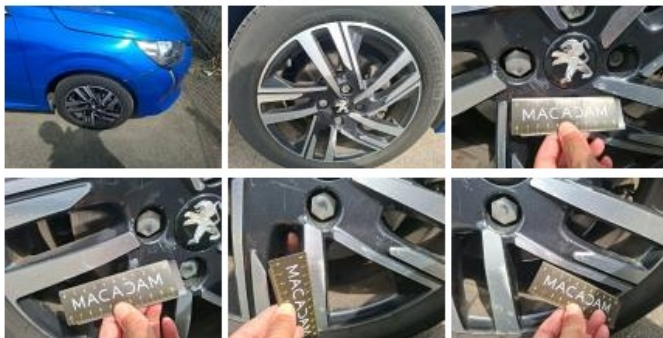
Jante alum. ARD bi-ton/polychrome, Griffe(s), Réparer/rempl. (montant forfaitaire)