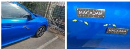
Boitier rétroviseur ext D, Griffe(s), Peindre