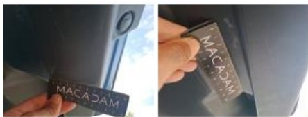
Pare-chocs AR, Griffe(s), Peindre