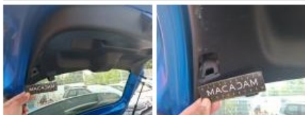
Garnit. couvercle AR, Griffe(s), Réparer/rempl. (montant forfaitaire)