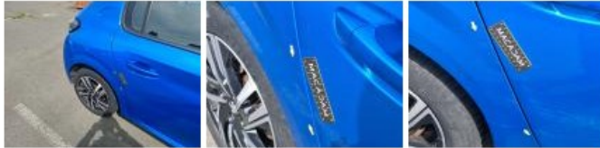
Porte AVD, Griffe(s), Peindre