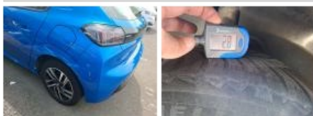
Jante alum. ARG bi-ton/polychrome, Griffe(s), Réparer/rempl. (montant forfaitaire)