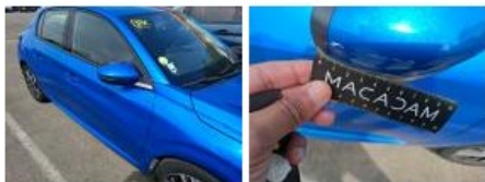
Montant de toit D, Bosse(s), LI - Réparer et peindre (complet)