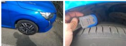
Jante alum. AVD bi-ton/polychrome, Griffe(s), Réparer/rempl. (montant forfaitaire)