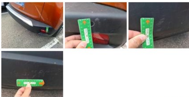
Coin pare-chocs ARG, Griffe(s), Peindre