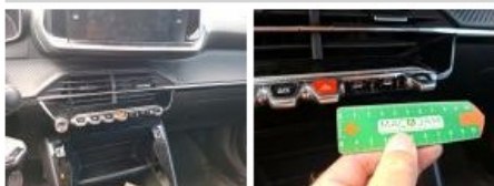
Intérieur, Sale, Nettoyage chimique