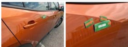
Porte AVD, Bosse(s) et griffe(s), Acceptable