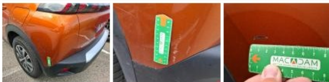
Moulure de coffre, Griffe(s), Peindre