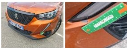
Optique AVG, Fêlure, E - Remplacer