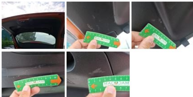
Moulure de pare-chocs AR, Griffe(s), Peindre