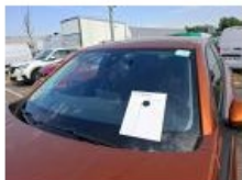
Pare-brise, Eclat(s), E - Remplacer