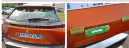
Pare-chocs AR, Griffe(s), E - Remplacer