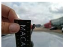
Carrosserie, Grêle, Forfait grêle (forte)