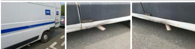
Montant de toit G, Bosse(s) et griffe(s), LI - Réparer et peindre (complet)