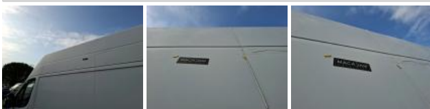
Coin de panneau ARG, Bosse(s) et griffe(s), LI - Réparer et peindre (complet)