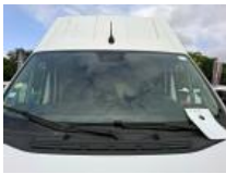
Pare-brise, Eclat(s), E - Remplacer