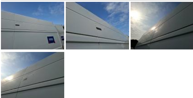
Montant de toit G, Griffe(s), Peindre