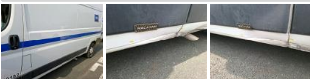
Panneau ARG, Bosse(s) et griffe(s), LI - Réparer et peindre (complet)