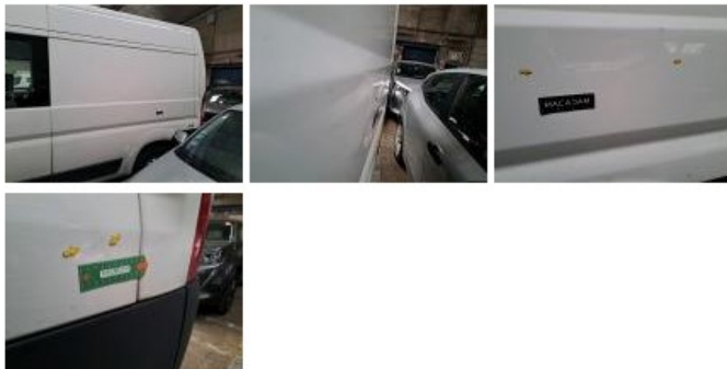
Moulure d'aile ARG, Griffe(s), Réparer/rempl. (montant forfaitaire)