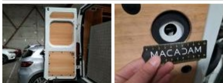
3ème feu stop, Cassé, E - Remplacer