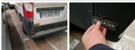
Pare-chocs AR, Déformé / Forcé, E - Remplacer