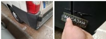
Bas de caisse ext D, Bosse(s), LI - Réparer et peindre (complet)