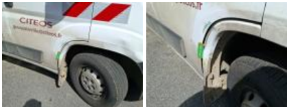
Aile AVD, Bosse(s) et griffe(s), Le - Remplacer et peindre