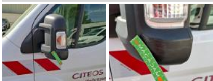
Répétiteur G, Fêlure, E - Remplacer