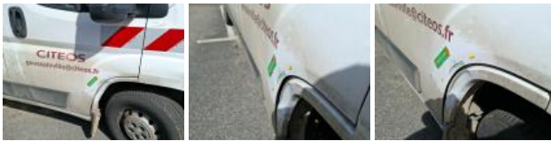
Montant milieu D, Bosse(s) et griffe(s), LI - Réparer et peindre (complet)