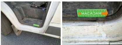
Garniture intérieur, Manque, E - Remplacer