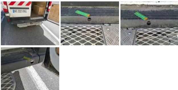
Bas de caisse int AVG, Bosse(s), LI - Réparer et peindre (complet)