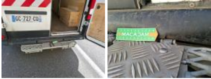
Serrure de coffre, Cassé, E - Remplacer