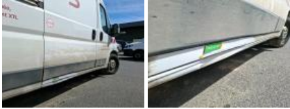
Bas de caisse ext D, Bosse(s) et griffe(s), LI - Réparer et peindre (complet)