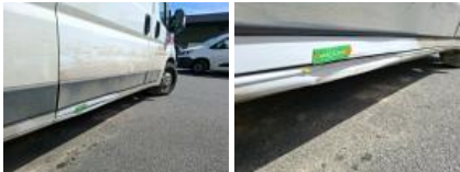
Porte AVD, Bosse(s) et griffe(s), LI - Réparer et peindre (complet)