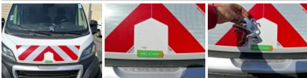
Pare-chocs AVD, Griffe(s), Acceptable