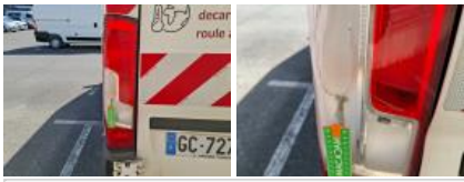
Joint de porte AR, Déchirure, E - Remplacer