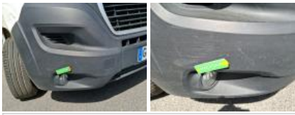
Pare-chocs AVG, Griffe(s), Acceptable