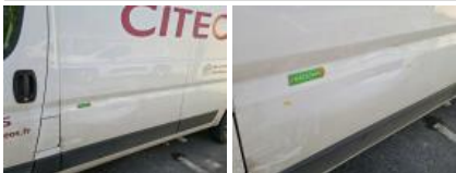
Panneau ARG, Bosse(s), LI - Réparer et peindre (complet)