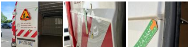
Feu ARG, Cassé, E - Remplacer