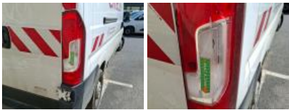
Coin pare-chocs ARD, Griffe(s), Acceptable